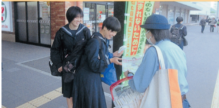
防犯ボランティア等による広報活動【米子】