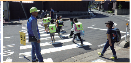
防犯ボランティア等による見守り活動【智頭】