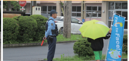
防犯ボランティア等によるあいさつ運動【黒坂】