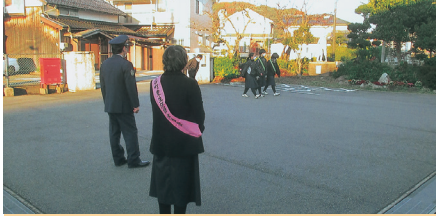
防犯ボランティア等による広報活動【浜村】