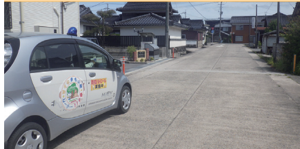
青パトによる見守り活動【境港】