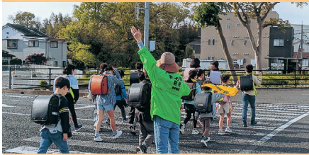
防犯ボランティアによる見守り活動【鳥取】