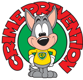
防犯マスコット・CPくん