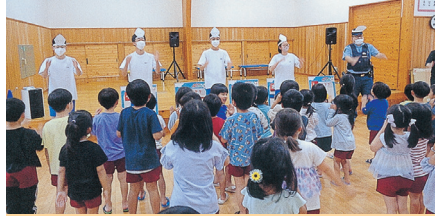
こども園における防犯講習【倉吉】