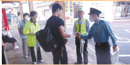
防犯ボランティア等による広報活動【郡家】