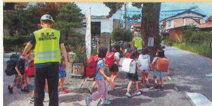
防犯ボランティアによる見守り活動【境港】