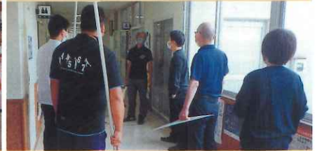
小学校における不審者対応訓練【琴浦大山】