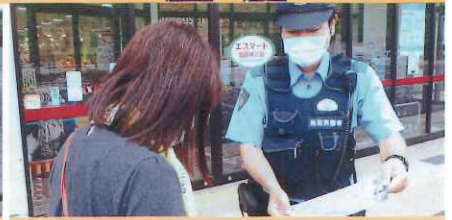
防犯の日における広報活動【智頭】