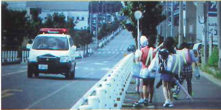
下校時の見守り活動【浜村】