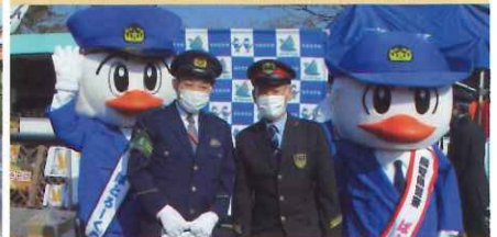
JR黒坂駅における広報活動【黒坂】