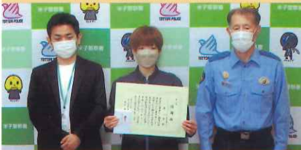
特殊詐欺水際阻止功勞の表彰【米子】