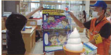
少年健全育成指導員との街頭補導活動【倉吉】