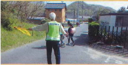
防犯ボランティアによる見守り活動【鳥取】