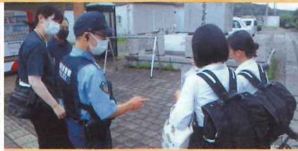
青少年健全育成合同街頭活動【郡家】